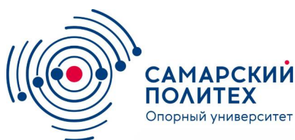
Самарский государственный технический университет