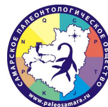
Самарское палеонтологическое общество