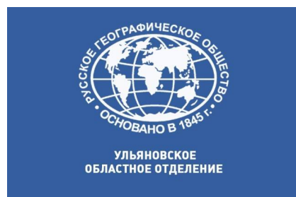
Ульяновское региональное отделение Русского географического общества