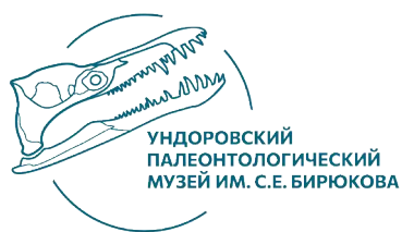
Ундоровский палеонтологический музей им. С.Е. Бирюкова