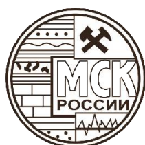
Меловая комиссия Межведомственного стратиграфического комитета