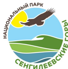
Национальный парк «Сенгилеевские горы»