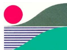
Институт экологии Волжского бассейна РАН