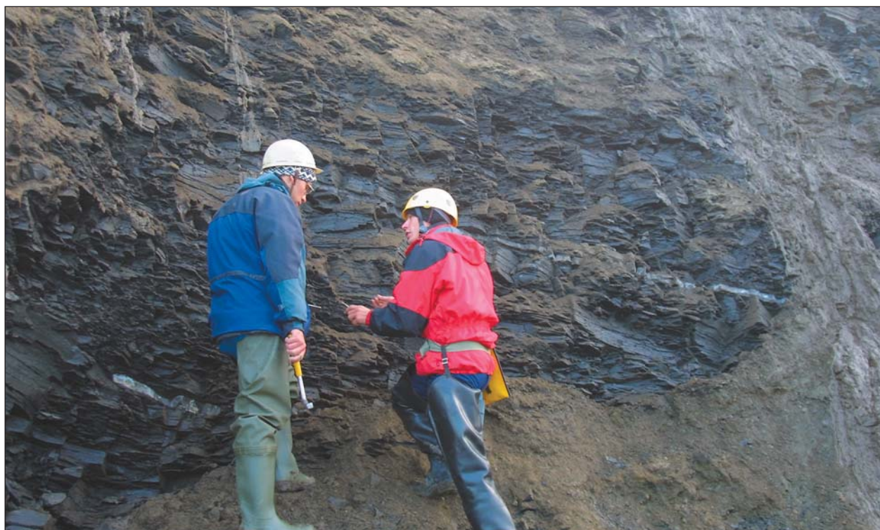
Высокоуглеродистые черные сланцы на границе юрской и меловой систем — временные аналоги баженовской свиты Западной Сибири на п-ове Нордвик (море Лаптевых), фиксирующие самое высокое стояние уровня моря в Арктике в мезозое.

За какую же часть 500-метрового столба отвечала эвстатика? Ответ на вопрос вряд ли следует искать в погружавшихся областях. Для этих целей наиболее подходят стабильные в геологическом времени блоки Земли — такие, как Русская и Сибирская платформы. Особенно незначительные вертикальные движения испытывала в течение сотен миллионов лет центральная часть Русской платформы, о чем свидетельствуют небольшая мощность осадочных морских отложений (от самых древних, кембрийских, до самых молодых — четвертичных) и отсутствие признаков даже сла-